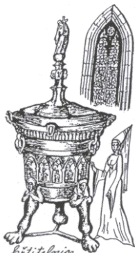
Křtitelnice, 1414 - Praha, chrám, Janův Náměstí před Týnem

(antika, gotika, renesance, baroko, rokoko, empír, secese)