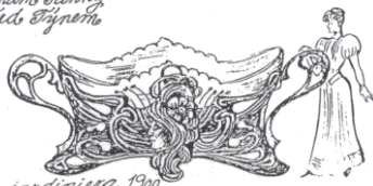
jablonice, 1900 (sít zinnovýma) nádobu na květiny, se skleněnou výplní