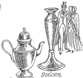
svícen, kávová konvice, začátek 19. století