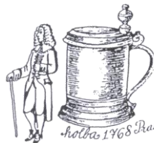
holba 1768 Praha